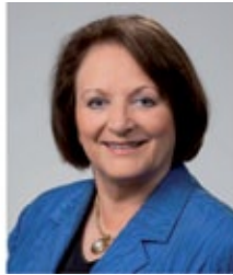
Sabine Leutheusser- Schnarrenberger